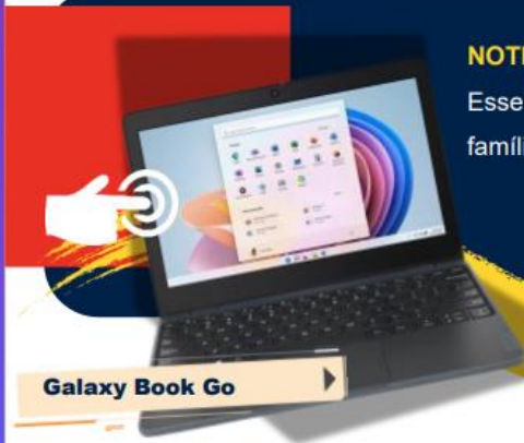
Galaxy Book Go